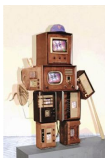
Sculptures de Nam June Paik

Faire réfléchir à l'invention de la télévision et son influence sur les relations humaines. S'interroger sur sa place dans l'art.